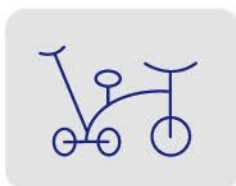
有推杆婴幼儿三轮车