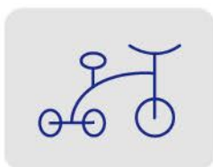
无推杆婴幼儿三轮车